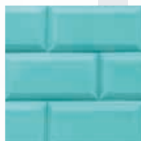
Turquesa Turquoise Turquoise Turquesa