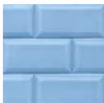
Azul claro Light Blue Bleu clair Azul claro