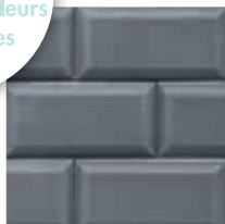
Grís Antracita Anthracite Grey Grís Anthracite Cinza Antracite

[PT] Cores disponíveis em acabamento brilhante. Milhares de cores no nosso sistema tintométrico. (Pergunte ao seu revendedor).