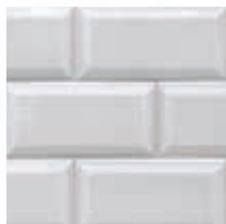
Niebla Foggy Grey Grís Brouillard Cinza Névoa