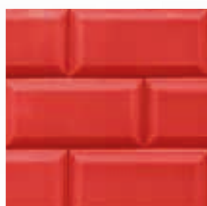
Rojo Red Rouge Vermelho