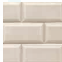
Topo cálido Warm Taupe Taupe Taupe