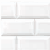
Blanco White Blanc Branco

[ES] Blanco disponible en brillo y satinado.