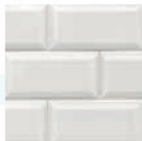
Lino Linen Lin Linho